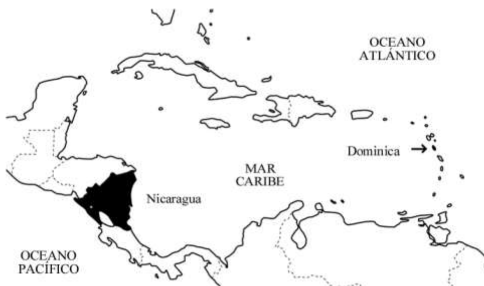
Figura 1. Región Mesoamericana y Caribeña

En 2011 se comienza implementar algo similar en Nicaragua (Fig. 1), con la colaboración entre ITME y el Centro de Investigación en Sistemas de Información Geográfica de la Universidad Nacional Autónoma de Nicaragua. Los primeros resultados incluyen una base de datos parcial para el litoral pacífico de Nicaragua, accesible vía www.itme.org/mhni . Aquí presentamos los procesos principales en el desarrollo y la implementación de tales sistemas y como se pueden aplicar en otros lugares. A base de estos dos estudios de caso, se comparan los formatos logísticos y metodológicos para un SIPIAM en litorales insulares y continentales.