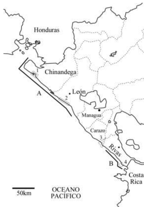
Figura 3. Regiones consideradas en el SIPIAM de Nicaragua. Chinandega y León con los manglares mejor desarrollados (A). Rivas con comunidades epibénticas, sésiles, incluso arrecifes coralinos, en sustratos rocosos (B). Reservas Naturales (1) Estero Padre Ramos y (2) Isla Juan Venado, Reservas Biológicas Rio Escalate-Chococente (3) y La Flor (4).

marinos, y localizar estudios previos relevantes. Estos obstáculos se enfrentaron con un taller organizado por CSIG de la UNAN León, en con la meta de investigar y documentar la distribución de ambientes marinos en los departamentos de Chinandega, León, y Rivas (Fig. 3). El taller siguió la estructura de los pasos utilizados en Dominica, con algunas excepciones (Tabla 1). Para facilitar la colecta de información no publicada, se utilizaron cuestionarios mandados a investigadores interesados en compartir sus observaciones. Para compartimentizar la catalogización de datos existentes y la planificación de nuevos estudios, la costa pacífica fue dividida según los departamentos legislativos. Utilizando los mismos criterios utilizados en Dominica, seis subregiones se delinearon en el departamento de Chinandega y dos regiones en cada uno de los departamentos de León y Rivas. Los tipos de hábitat existentes, se clasificaron según el conocimiento local de los participantes del taller. En Chinandega y León, imágenes de satélite se georeferenciaron durante excursiones terrestres, mientras que buceos fueron ejecutados en Rivas.